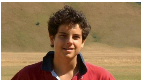
Bienheureux Carlo Acutis